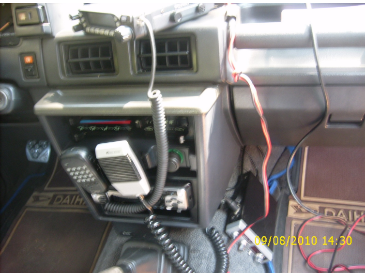
Ancora l'interno della "postazione mobile"