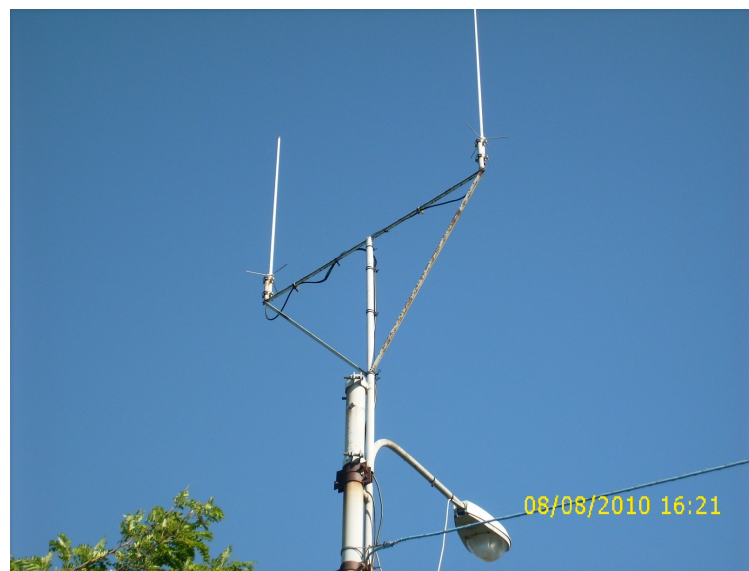
Ripetitore "S.Elia 145 600 SH -600" Molto spartano...