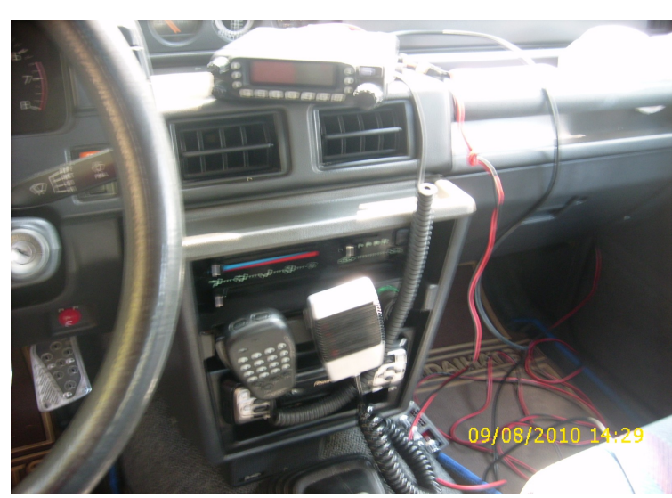
Interno dell'auto: Yeaesu FT-7800 e Midland 40Ch/CB