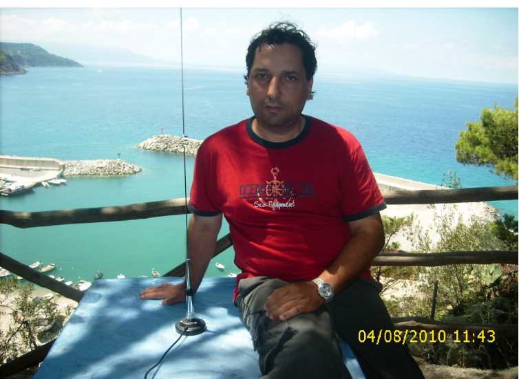
Io, il mare e l'antenna...