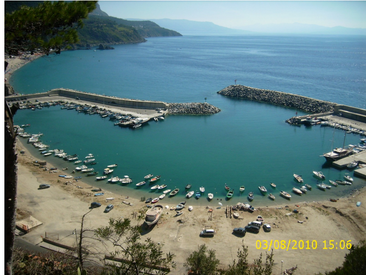
Splendida visuale sul mare dal camping in Calabria