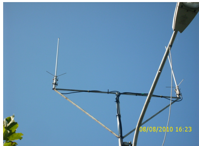
Il ponte VHF: due X/50 su un palo della luce...