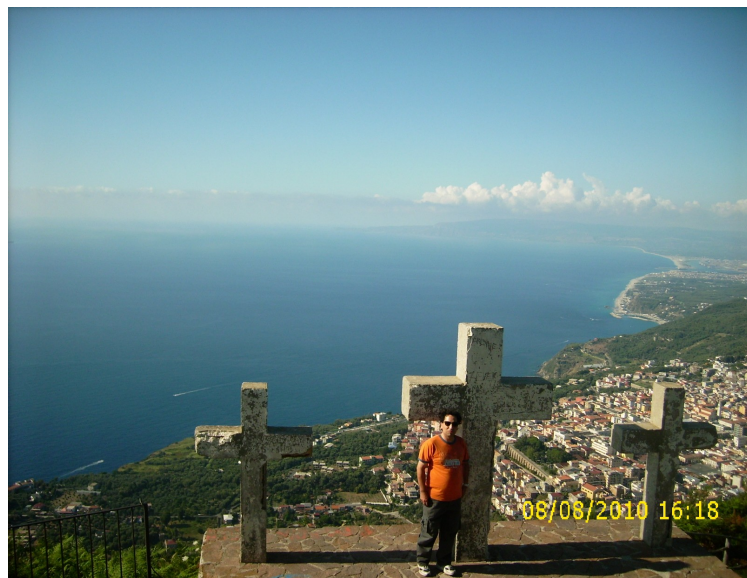
Le "Tre Croci", in vetta