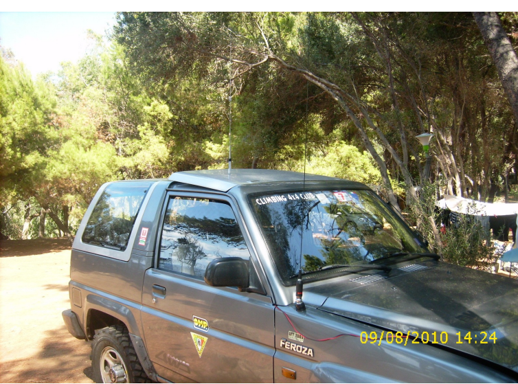
Antenne sulla macchina: Sirio Turbo 3000 e Diamond 777 bi-banda 144/430