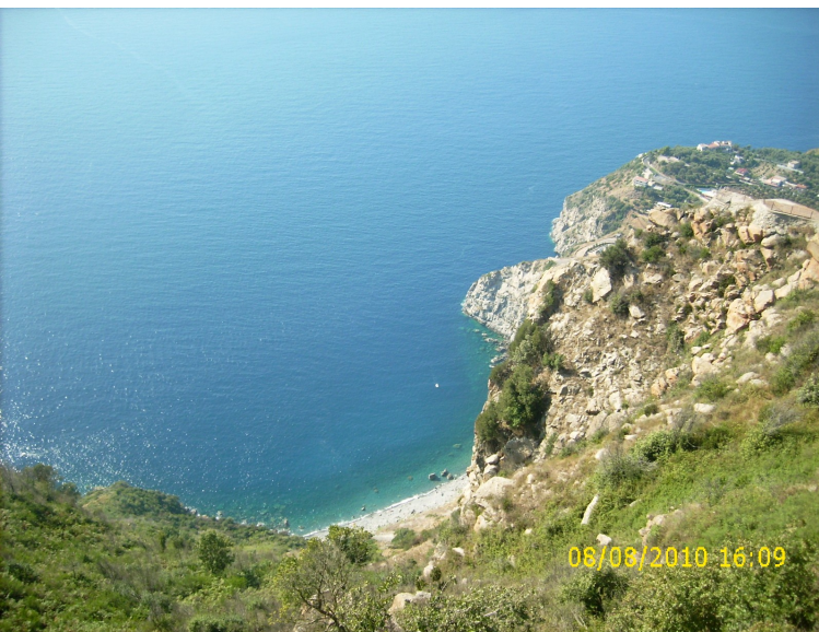
Vista dal M.te S.Elia 1000MT slm, Palmi (RC)