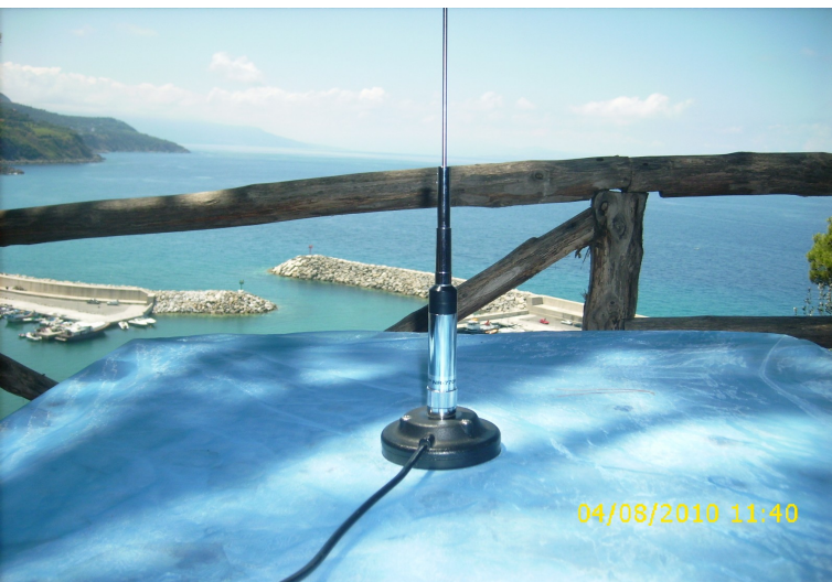
Antenna usata per la stazione da campo: bi-banda da BM