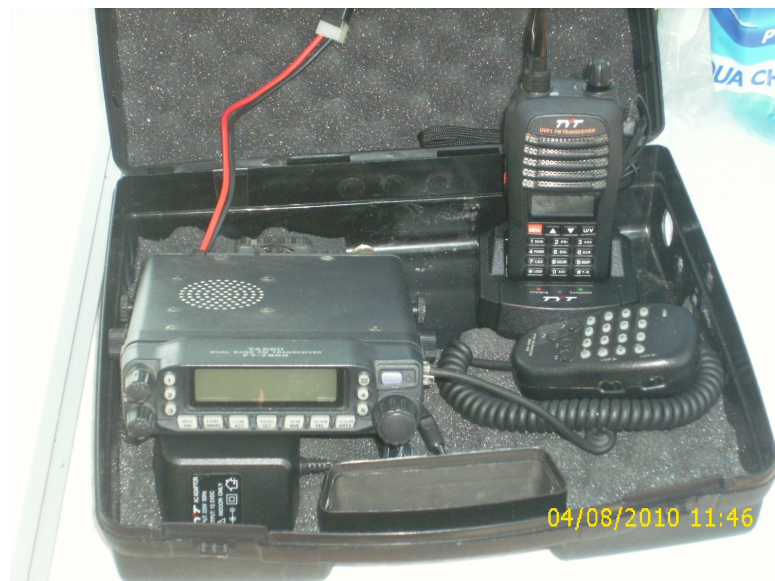
Apparato YEAESU FT/7800 e portatile bi-banda TYT in configurazione "radio-valigia da campo"