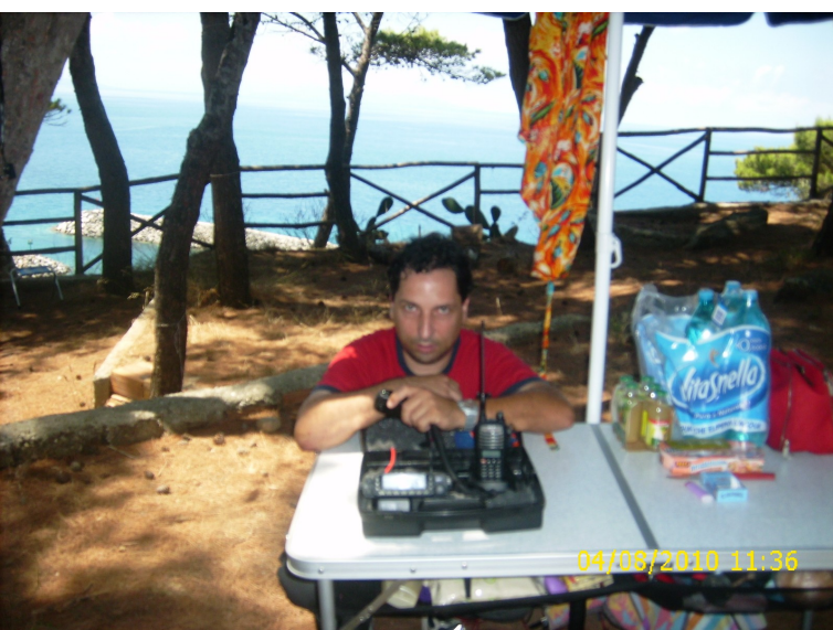
Io "in attività" nella stazione da campo...ottimi QSO!