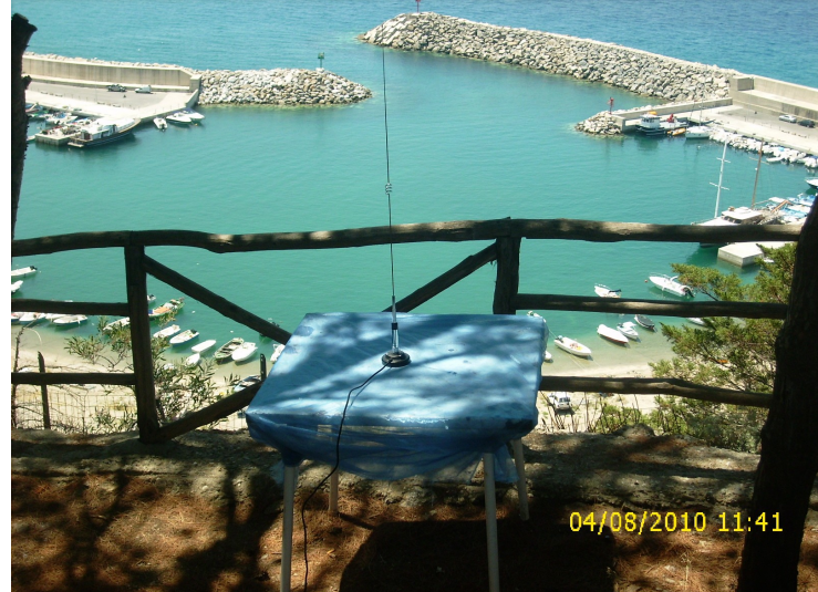
Antenna vista-mare con tavolo metallico "come piano di massa"