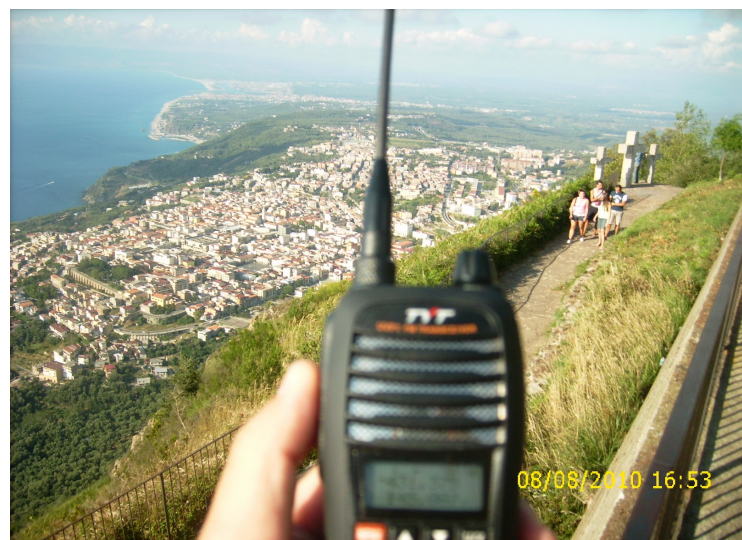
Ottimi collegamenti da portatile...ascoltavo perfettamente l'R/5 dei Castelli Romani!!! Notare la visuale...