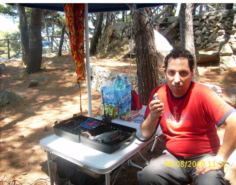
Così avevo organizzato la "stazione da campo"